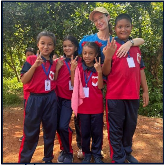
NEPAL, Tanau District