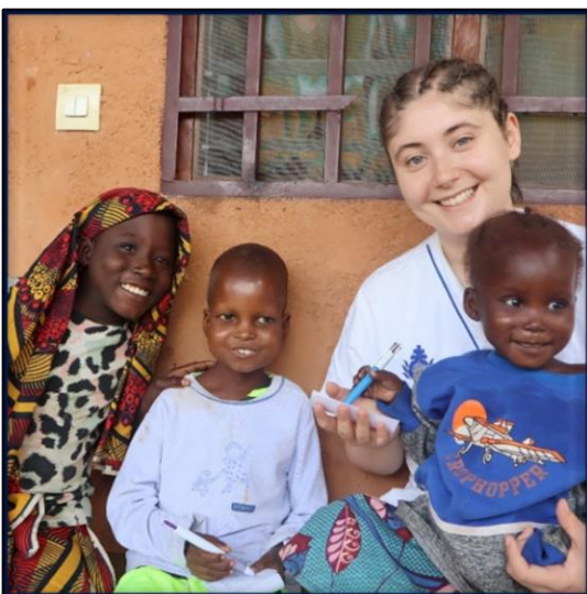
CAMERUN - Ngaoundal

Il Centre de Promotion Sociale (CPS) è la sede principale del COE in Camerun ed è nato con lo scopo di promuovere lo sviluppo umano, culturale e spirituale della popolazione locale. Fanno riferimento al CPS: l'istituzione scolastica "Nina Gianetti" che comprende il College Technique "Nina Gianetti" (creato nel 1977), l'Istituto di Formazione Artistica -IFA (creato nel 1990), la scuola materna ed elementare "L'Espoir" (creata nel 1982); l'ospedale "Saint Luc", creato nel 1970; il Centro di Ascolto e Documentazione - CED, creato nel 2003; il Centro d'Arte Applicata - CAA, creato nel 2004.