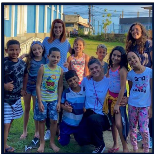
BRASILE - Petropolis