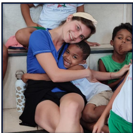
BRASILE - Ilheus